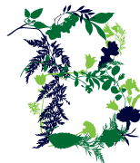
Botanická zahrada Praha